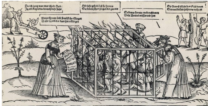
Erhard Schoen, Der Narrenkäfig , Holschnitt um 1530

– Erasmus von Rotterdam, Lob der Torheit , 1511