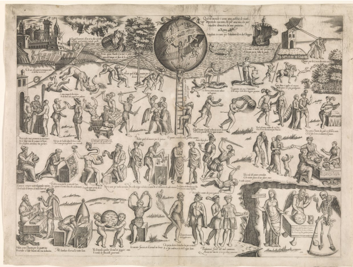
Sebastiano di Re, La gabbia de' matti (Der Narrenkäfig) um 1570

Folgen Sie Musica getuscht auf Youtube, Instagram, oder Facebook und abonnieren Sie unseren Newsletter unter